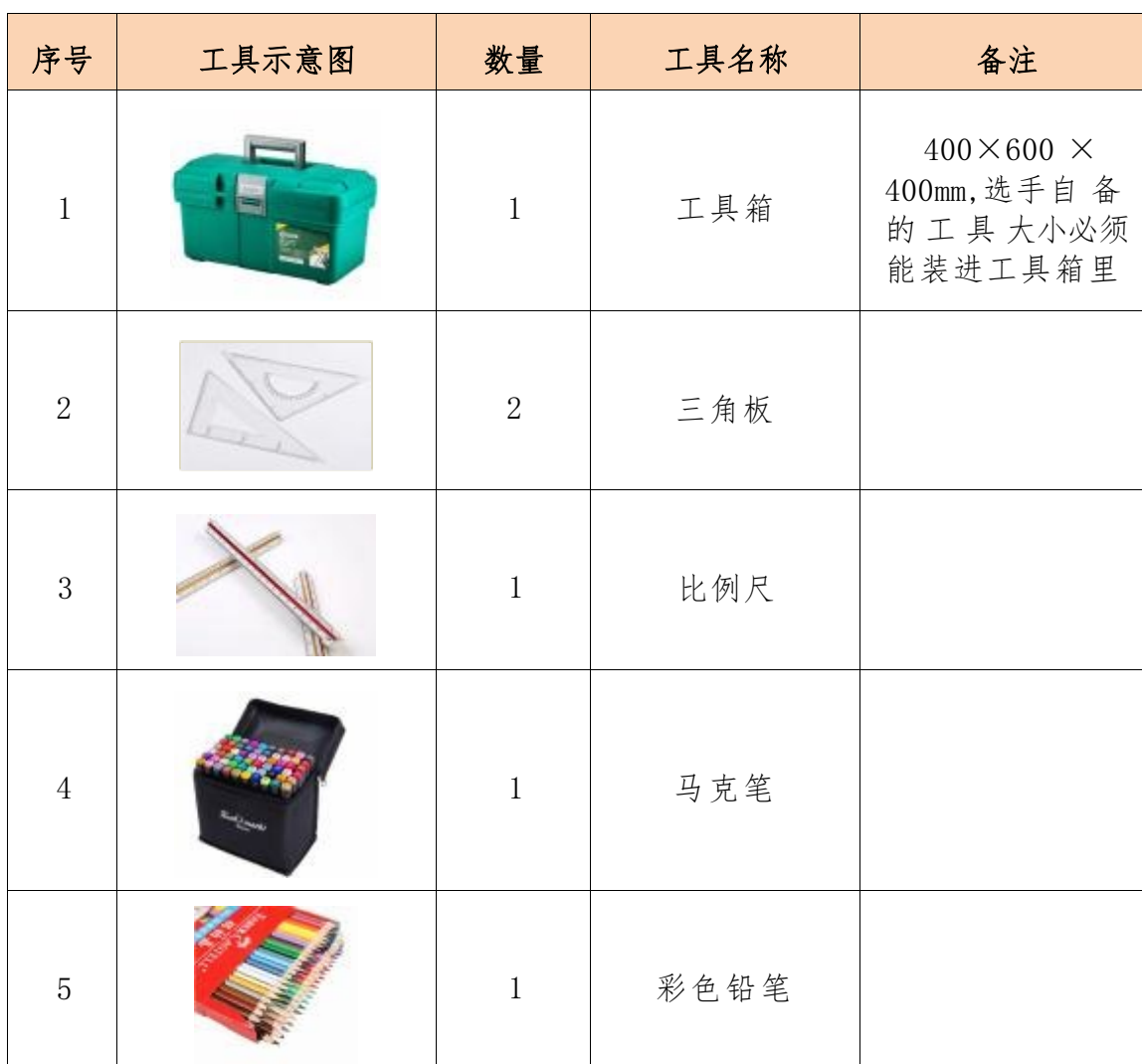
表 4 选手自备的辅助工具