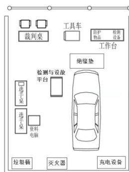
图电动汽车与底盘故障检修模块-场地布置图