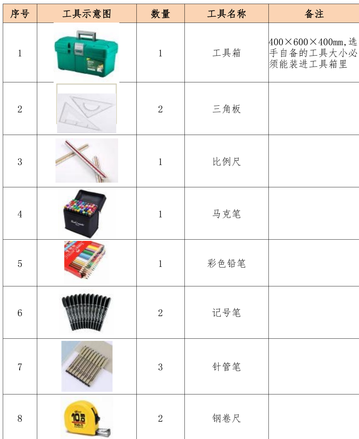
表 4 选手自备的辅助工具