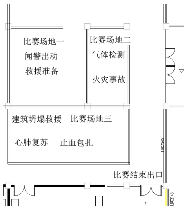
图 2 实践操作场地布置示意图