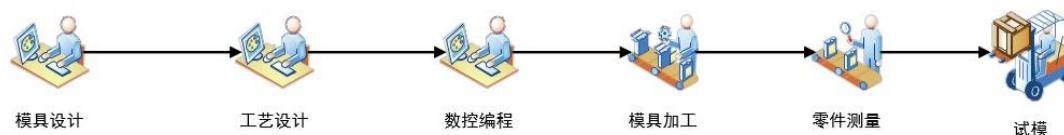
图 1 赛项流程

所有参赛代表队在规定时间内，使用同一套赛题，在三个场地或区域，完成三个模块比赛任务，赛事流程如图 1。