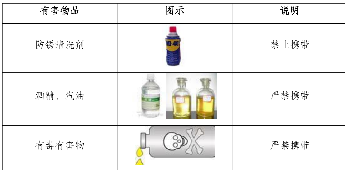
表14-3选手禁带的物品