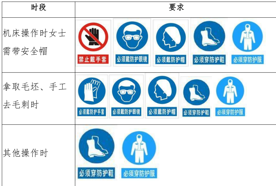
表14-2选手防护装备佩带要求

将提出警告并进行纠正。不听警告，不进行纠正的参赛选手会受到不允许进入竞赛现场、罚去安全分、停止比赛、取消竞赛资格等不同程度的惩罚。选手防护装备佩带要求见表14-2。