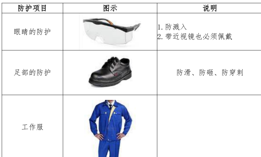
表14-1选手必备的防护装备