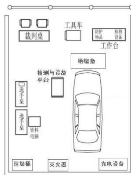
图电动汽车与底盘故障检修模块-场地布置图