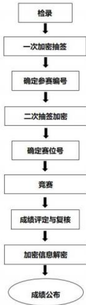
图 1 竞赛流程图