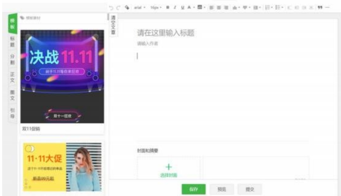
图 4 新媒体营销操作页面示意图